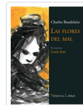
FLORES DEL MAL - ILUSTRADO - BAUDELAIRE, CHARLES