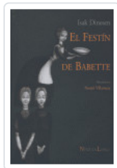
FESTIN DE BABETTE DINESEN, ISAK