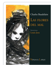
FLORES DEL MAL - ILUSTRADO- BAUDELAIRE, CHARLES