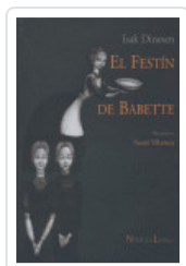
FESTIN DE BABETTE DINESEN, ISAK