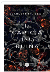
CARICIA DE LA RUINA, LA ST. CLAIR, SCARLETT