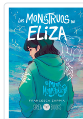
MONSTRUOS DE ELIZA, LOS ZAPPIA, FRANCESCA