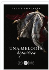
UNA MELODIA HIPNOTICA THALASSA, LAURA