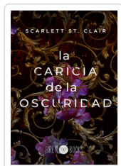
CARICIA DE LA OSCURIDAD, LA ST. CLAIR, SCARLETT