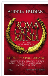
ULTIMO PRETORIANO, EL (ROMA CAPUT MUNDI) FREDIANI, ANDREA