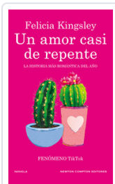
UN AMOR CASI DE REPENTE KINGSLEY, FELICIA