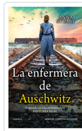
ENFERMERA DE AUSCHWITZ, LA STUART, ANA