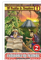
TU DECIDES, 3 CAZADORES TESOROS BABIANO, IVAN