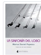
SINFONIA DEL LOBO, LA POPESCU, MARIUS