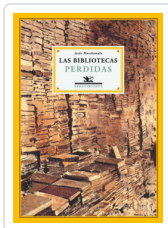
BIBLIOTECAS PERDIDAS MARCHAMALO, JESUS