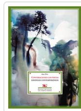
CONVERSACIONES CON POETAS EIRE, ANA