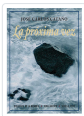
PROXIMA VEZ, LA CATANO, JOSE C.