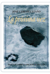
PROXIMA VEZ, LA CATANO, JOSE C.