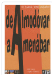
DE ALMODOVAR A AMENABAR LOPOZ, JOSE L.