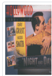
HOLLYWOOD LOBBY CARDS BALMORI, GUILLERMO