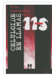
CELULOIDE EN LLAMAS HUERTA, MIGUEL A.