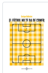
FUTBOL NO TE DA DE COMER, EL BALLESTER, ENRIQUE