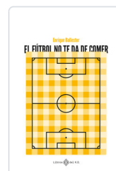
FUTBOL NO TE DA DE COMER, EL BALLESTER, ENRIQUE