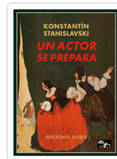
UN ACTOR SE PREPARA STANISLAVSKI, K.