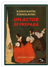
UN ACTOR SE PREPARA STANISLAVSKI, K.