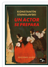
UN ACTOR SE PREPARA STANISLAVSKI, K.