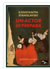
UN ACTOR SE PREPARA STANISLAVSKI, K.