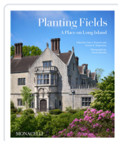
PLANTING FIELDS AA.VV.