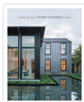
SHINGLE AND STONE. THOMAS KLIGERMAN HOUSES KLIGERMAN, THOMAS