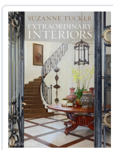
EXTRAORDINARY INTERIORS TUCKER, SUZANNE