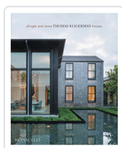
SHINGLE AND STONE. THOMAS KLIGERMAN HOUSES KLIGERMAN, THOMAS