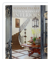
EXTRAORDINARY INTERIORS TUCKER, SUZANNE