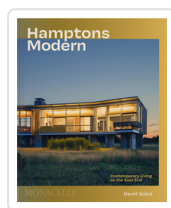
HAMPTONS MODERN. CONTEMPORARY LIVING ON THE EAST END SOKOL, DAVID