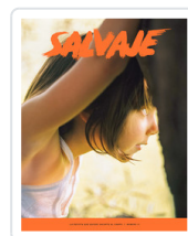
REV. SALVAJE,17 VERANO 2023 AA.VV.