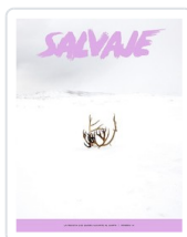
REV. SALVAJE,15 INVIERNO 2022 AA.VV.