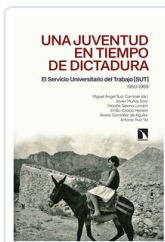
UNA JUVENTUD EN TIEMPOS DE DICTADURA AA.VV.