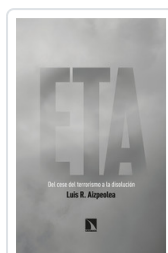
ETA. DEL CESE DEL TERRORISMO A LA DISOLUCIÓN AIZPEOLEA, LUIS R.