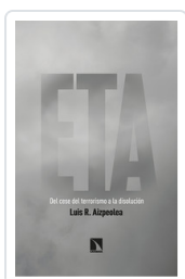
ETA. DEL CESE DEL TERRORISMO A LA DISOLUCION AIZPEOLEA, LUIS R.