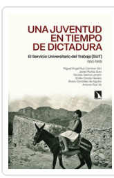
UNA JUVENTUD EN TIEMPOS DE DICTADURA AA.VV.