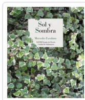
SOL Y SOMBRA ESCOLANO, MERCEDES