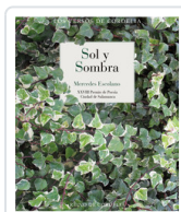
SOL Y SOMBRA ESCOLANO, MERCEDES