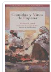
COMIDAS Y VINOS DE ESPAÑA FORD, RICHARD