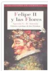
FELIPE II Y LAS FLORES DE AMEZUA, AGUSTIN