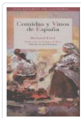
COMIDAS Y VINOS DE ESPAÑA FORD, RICHARD