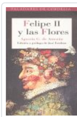
FELIPE II Y LAS FLORES DE AMEZUA, AGUSTIN