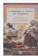
COMIDAS Y VINOS DE ESPAÑA FORD, RICHARD