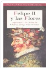
FELIPE II Y LAS FLORES DE AMEZUA, AGUSTIN