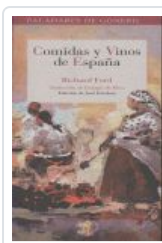
COMIDAS Y VINOS DE ESPAÑA FORD, RICHARD