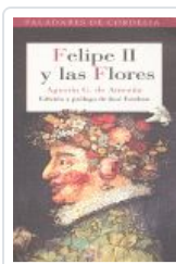
FELIPE II Y LAS FLORES DE AMEZUA, AGUSTIN