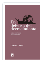
EN DEFENSA DEL DECRECIMIENTO TAIBO, CARLOS