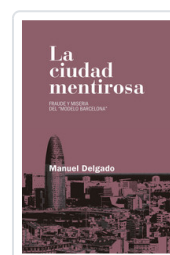
CIUDAD MENTIROSA, LA DELGADO, MANUEL