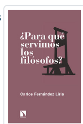
PARA QUE SERVIMOS LOS FILOSOFOS FERNÁNDEZ, CARLOS