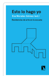
ESTO LO HAGO YO MORALES, EVA