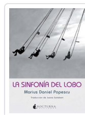
SINFONIA DEL LOBO, LA POPESCU, MARIUS