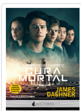
CORREDOR LABERINTO, 3 CURA MORTAL DASHNER, JAMES