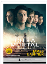
CORREDOR LABERINTO, 3 CURA MORTAL DASHNER, JAMES