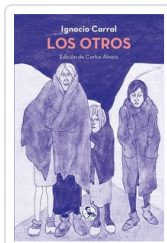
OTROS, LOS CARRAL, IGNACIO