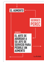
AUMENTO / ARTE DE ABORDAR PEREC, GEORGES