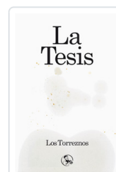
TESIS, LA LOS TORREZNOS