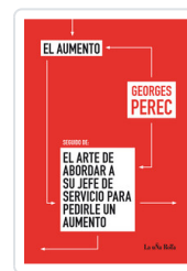
AUMENTO / ARTE DE ABORDAR PEREC, GEORGES