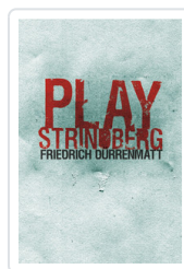
PLAY STRINDBERG DURRENMATT, FRIEDRICH