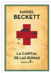
CAPITAL DE LAS RUINAS BECKETT, SAMUEL