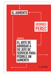
AUMENTO / ARTE DE ABORDAR PEREC, GEORGES