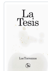
TESIS, LA LOS TORREZNOS