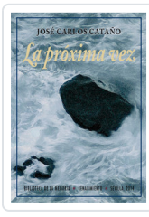
PROXIMA VEZ, LA CATANO, JOSE C.