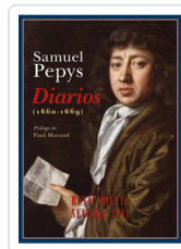
DIARIOS (1660-1669) PEPYS, SAMUEL