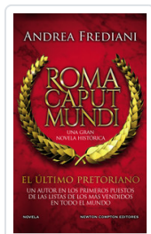
ULTIMO PRETORIANO, EL (ROMA CAPUT MUNDI) FREDIANI, ANDREA