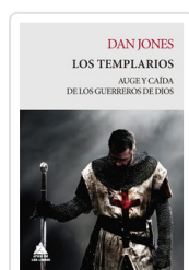
TEMPLARIOS, LOS. AUGE Y CAÍDA DE LOS GUERREROS DE DIOS JONES, DAN