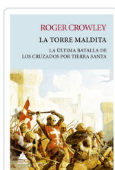
TORRE MALDITA. LA ULTIMA BATALLA DE LOS CRUZADOS POR TIERRA SANTA CROWLEY, ROGER