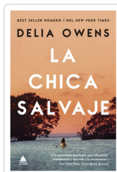
CHICA SALVAJE, LA OWENS, DELIA