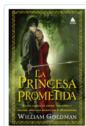
PRINCESA PROMETIDA, LA GOLDMAN, WILLIAM