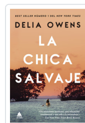
CHICA SALVAJE, LA OWENS, DELIA