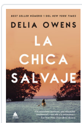
CHICA SALVAJE, LA OWENS, DELIA