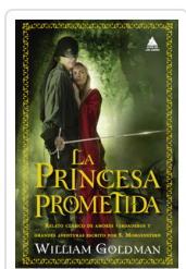
PRINCESA PROMETIDA, LA GOLDMAN, WILLIAM