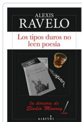
TIPOS DUROS NO LEEN POESIA, LOS RAVELO, ALEXIS