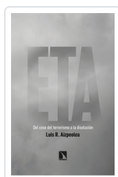
ETA. DEL CESE DEL TERRORISMO A LA DISOLUCIÓN AIZPELEA, LUIS R.