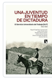
UNA JUVENTUD EN TIEMPOS DE DICTADURA AA.VV.