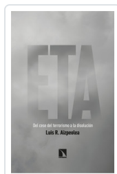
ETA. DEL CESE DEL TERRORISMO A LA DISOLUCIÓN AIZPEOLEA, LUIS R.