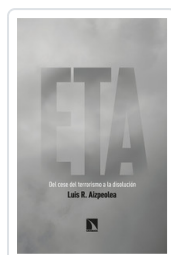
ETA. DEL CESE DEL TERRORISMO A LA DISOLUCIÓN AIZPEOLEA, LUIS R.